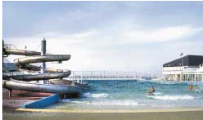
Beheiztes Wellenbad am Dorumer Strand mit Superrutsche, Wellnessbad und Gastronomie

Ein wunderschönes „Freizeit Domizil“ für Zwei. Interessante Innenarchitektur in einem wunderschönen Haus.